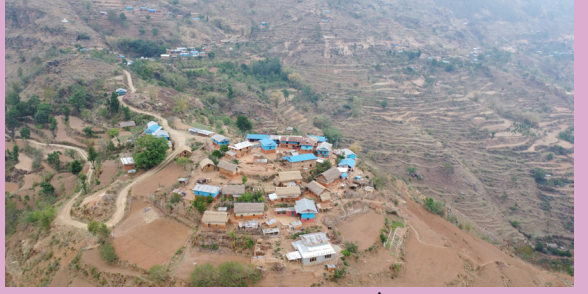
गोल टाकुरी गाउँ