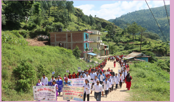
रेबिज दिवस मनाउँदै