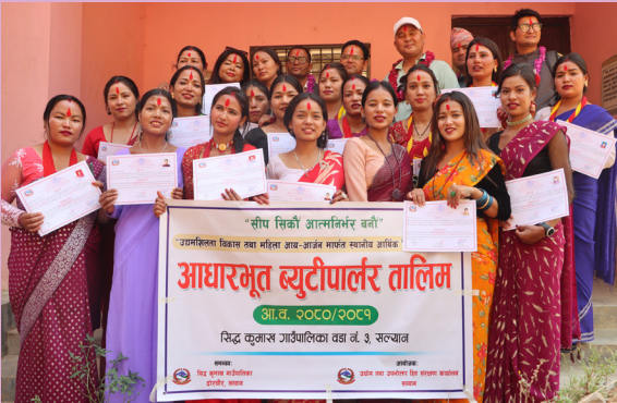
सिपमूलक तालिम समापन