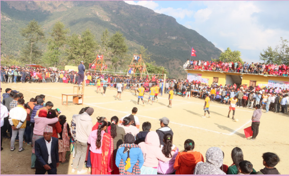
साइकुमारी मेला फल्लेखर्क