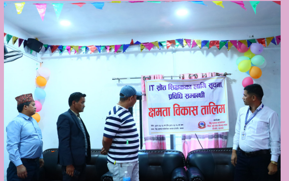
सूचना प्रविधि तालिम उद्घाटन