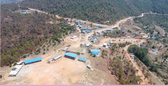
वडा नं. ५ छापडाँडा